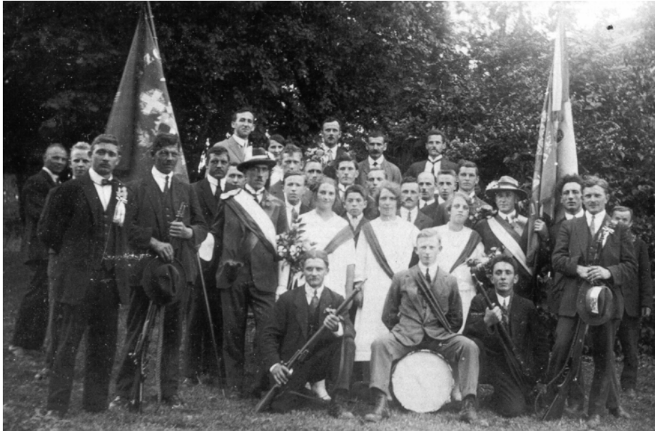
Vermutlich einziges Foto der alten Freischützen-Fahne anlässlich eines Festes