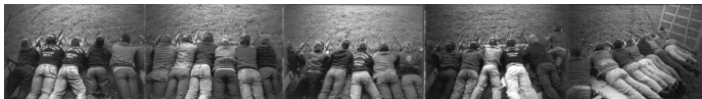
Letzte Schüsse im Bübliker Stand am 8. Oktober um 16 Uhr 36